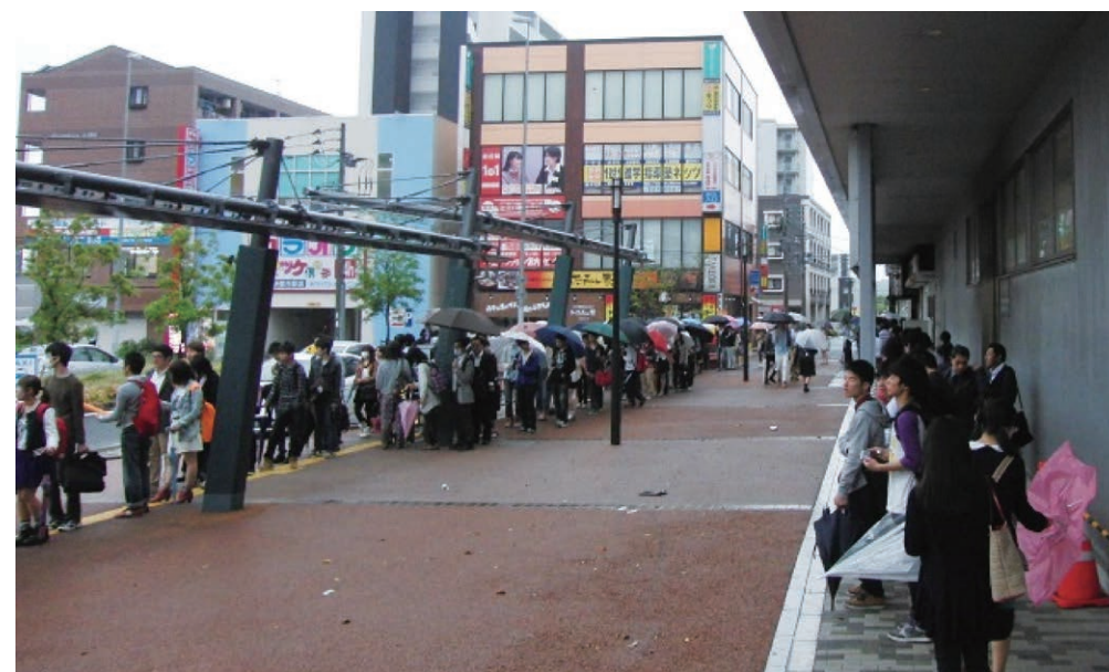
図 1.1.2 伊都キャンパス周辺の交通状況